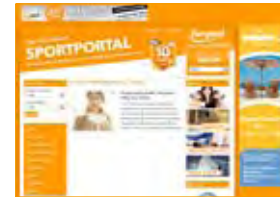
Banner 468 x 60 Pixel Skyscraper 160 x 600 Pixel ContentAd 300 x 250 Pixel